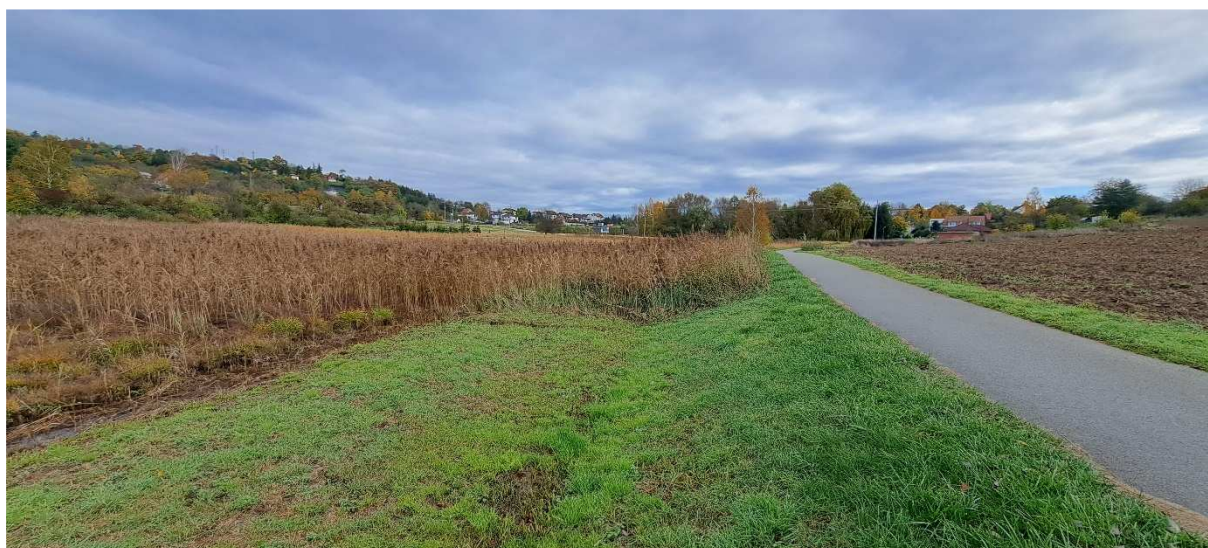
6. Pohled východním směrem na prostor tůň