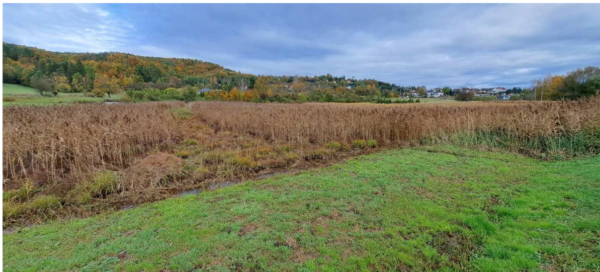
1. Pohled z jihozápadního rohu na lokalitu