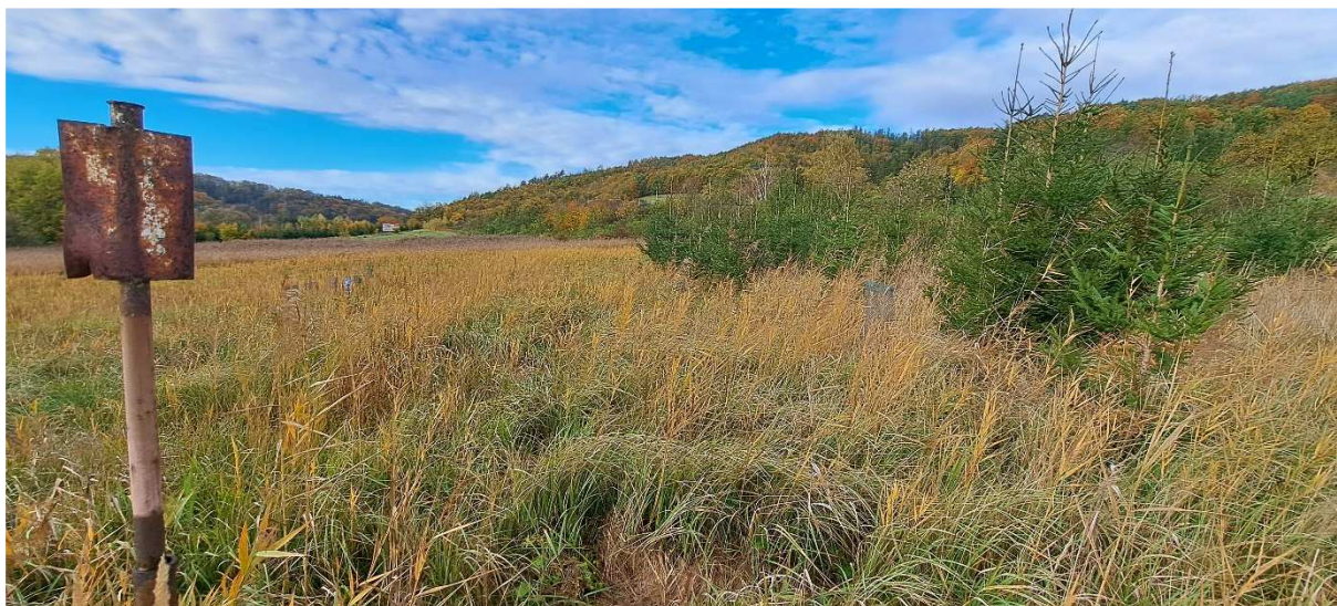
4. Pohled jižně na prostor výsadeb