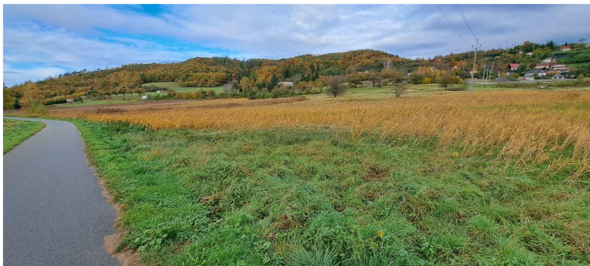
5. Pohled západním směrem na prostor tůň