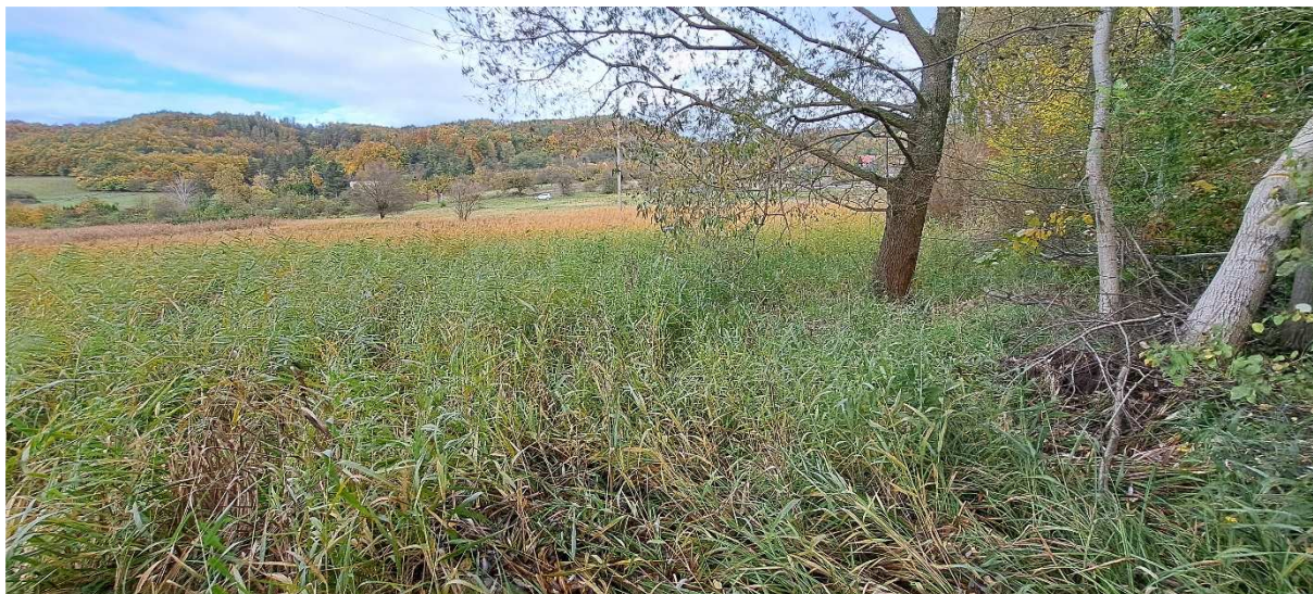
3. Pohled z jihovýchodního rohu lokality