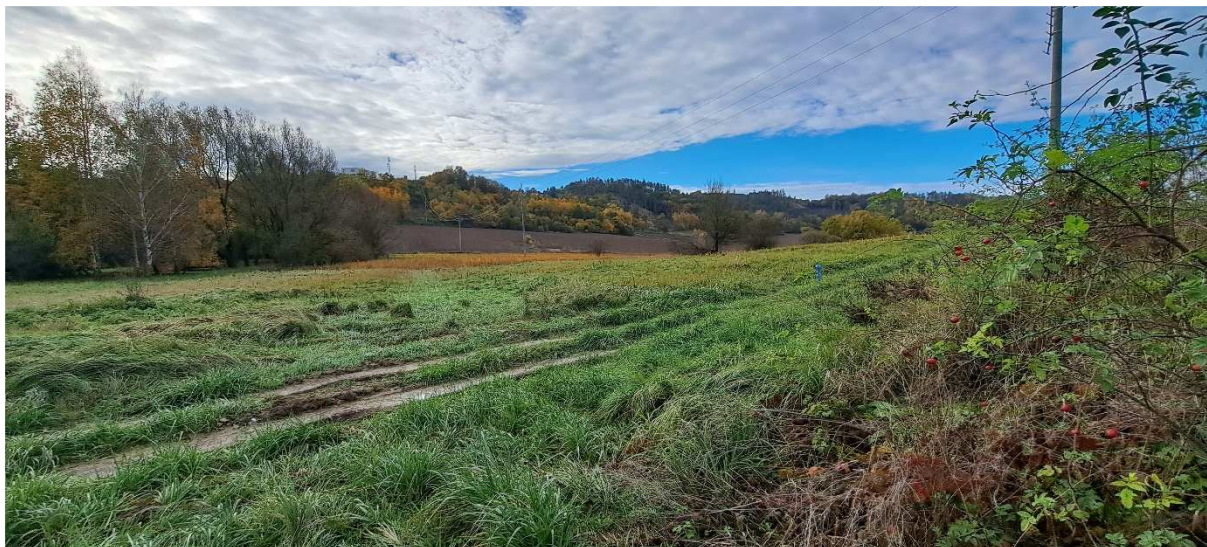
7. Pohled ze severovýchodního rohu na prostor pro výsadby