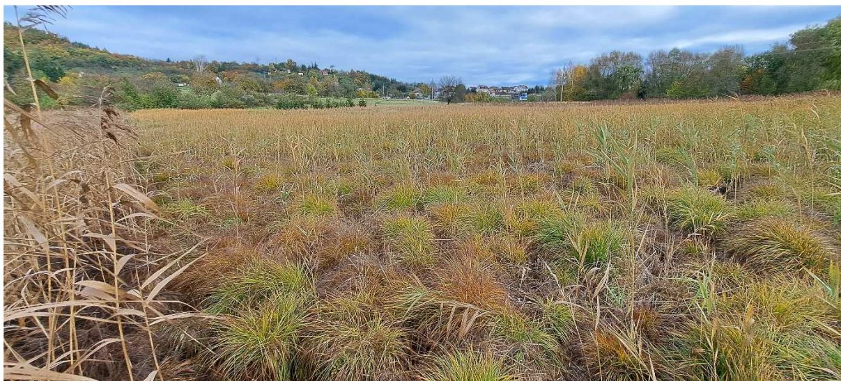
2. Pohled na prostor budoucích tůní